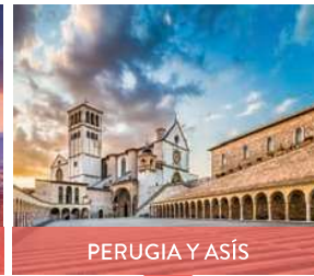
PERUGIA Y ASÍS