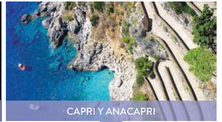
CAPRI Y ANACAPRI

Visita en lancha motors en la grota azul.