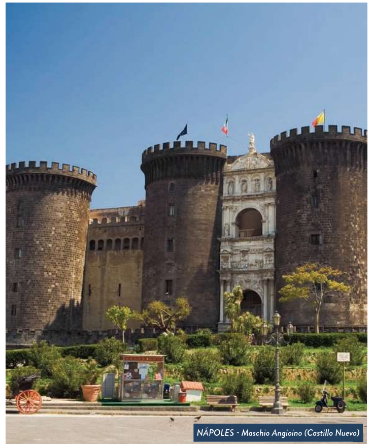
NÁPOLES - Maschio Angioino (Castillo Nuevo)